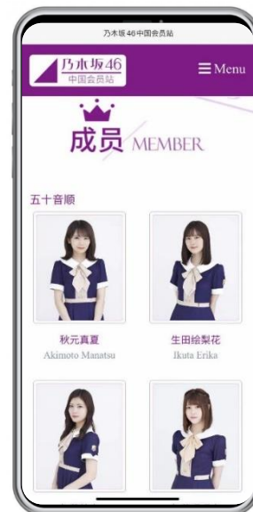
※スマートフォン版サイトイメージ