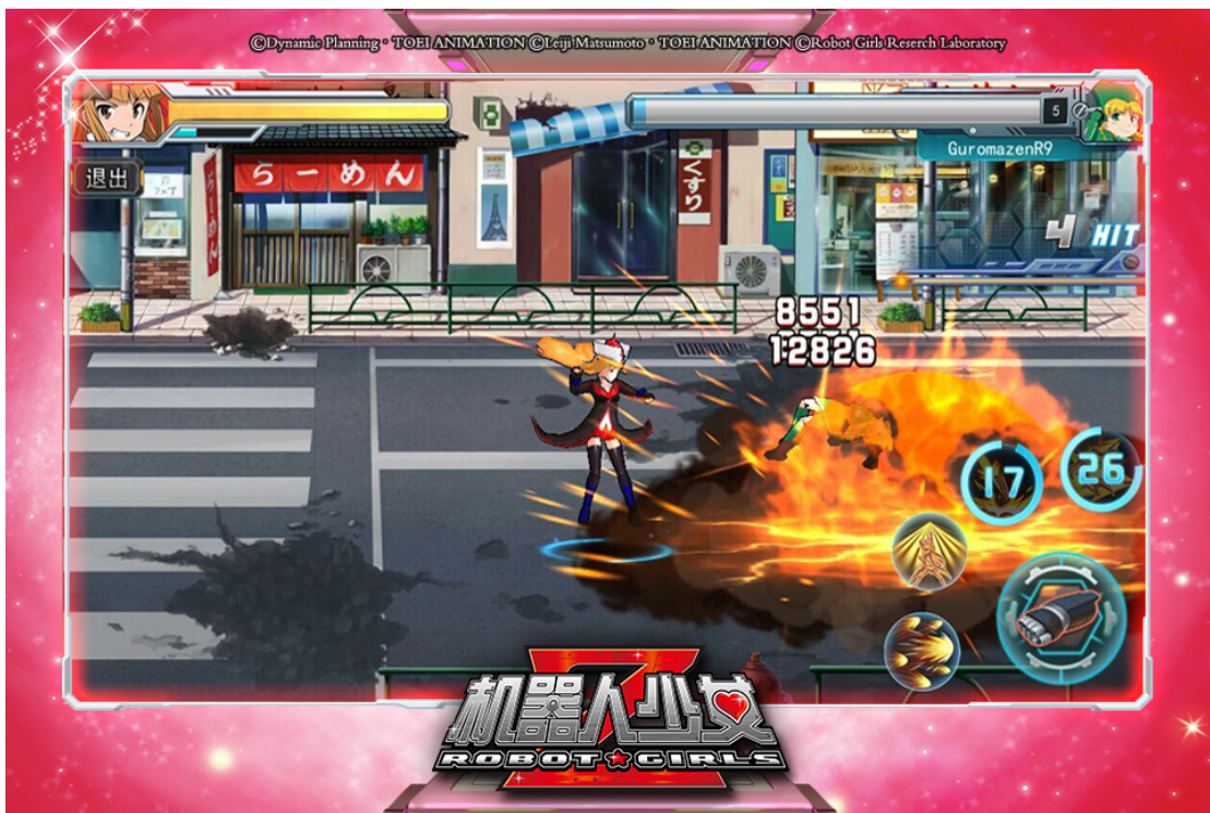
新バージョンのイメージ3

アクセスブライトは、今後も「ロボットガールズ Z」をはじめとする日本の IP コンテンツを、多くの中国のみなさまに楽しんでいただけるよう取り組んでまいります。