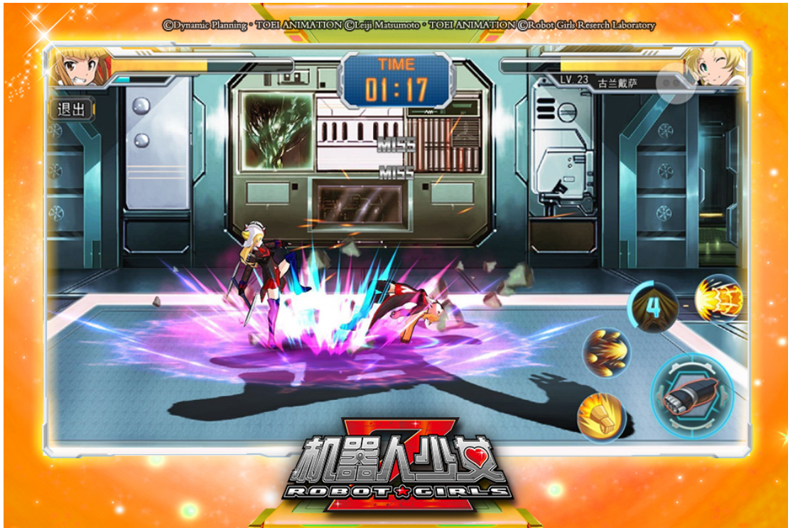
新バージョンのイメージ2